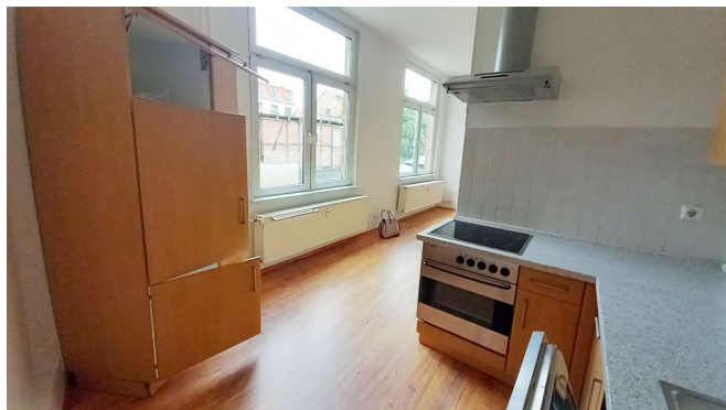
Küche Ansicht I