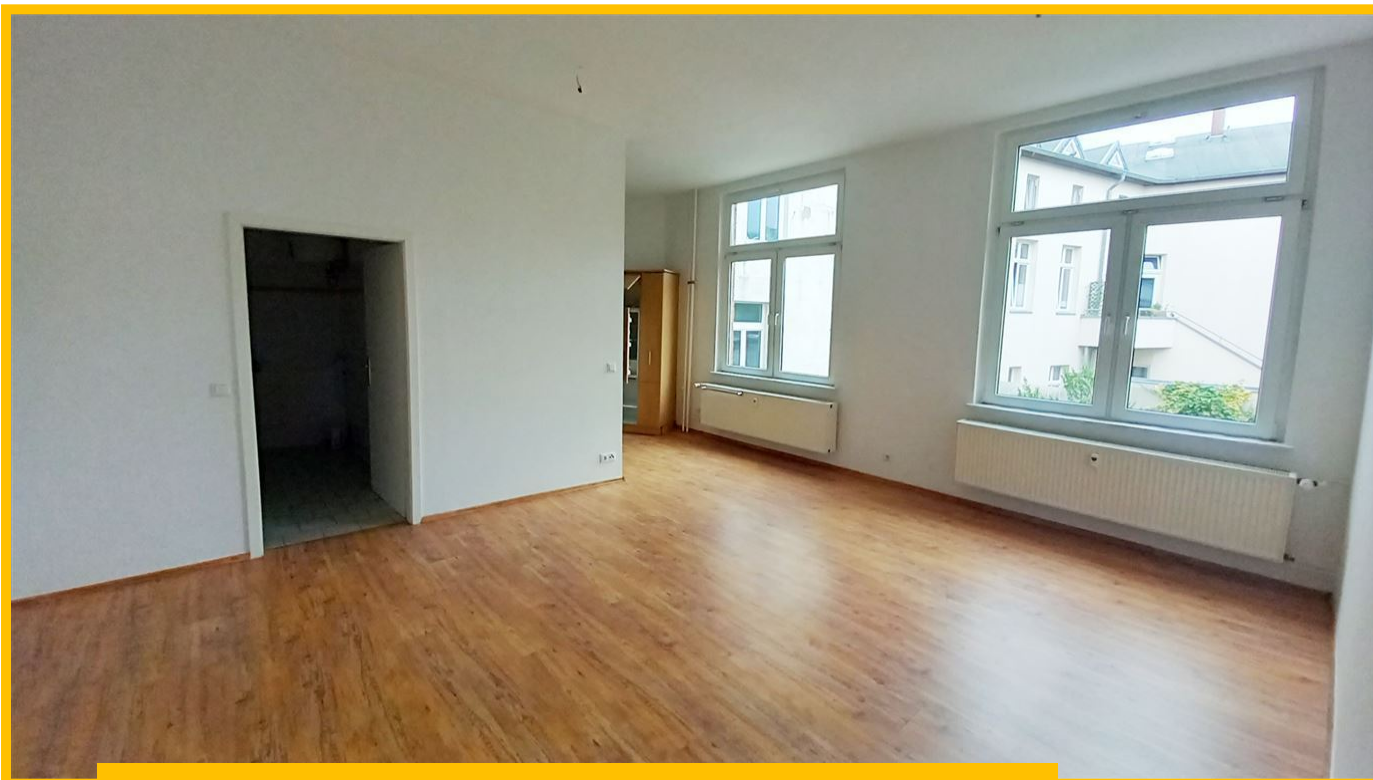
Objekt-Nr. 1004 | Kaltmiete: 600,00 € | Wohnfläche: 77,00 m 2