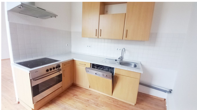
Küche Ansicht II