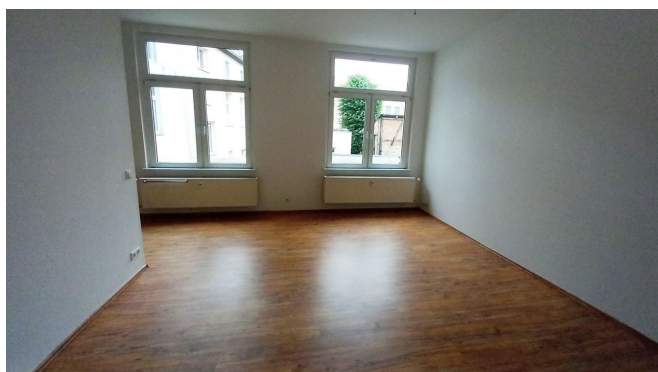
Wohnzimmer Ansicht II